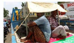
IMPACT SEED FUNDING (ISF) 2023

CLIMATE CHANGE DAN KESEHATAN PEKERJA DALAM PERSPEKTIF HUKUM PERDAGANGAN INTERNASIONAL