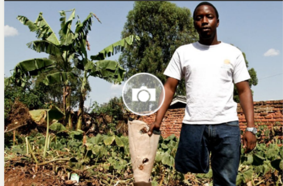
Foto-Essay Zehntausende Amputierte sind die lebendige Erinnerung an den Völkermord in Ruanda. Der Fotograf Tomaso Clavarino war Januar und Februar 2014 vor Ort und erzählt für den SPIEGEL von Menschen, die in einer Gesellschaft leben, die ihre eigene Vergangenheit gern vergessen würde.

Unruhen, ethnisches Gezänk, Bruderzwist. Im SPIEGEL, Ausgabe 16/1994, stand: „Anarchie, die aus sich selbst lebt“. Typisch Afrika eben. „Ruanda?“, meinte ein britischer Kollege, „da hauen sich wieder mal die Tutsi und die Hutu die Köpfe ein, der ewige Stammeskrieg.“